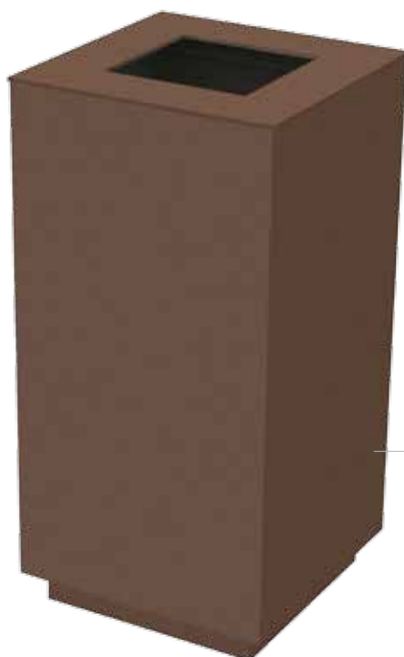
Acabado color MARSON Finition teinte MARSON MARSON color finish