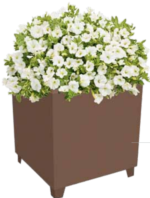
Acabado color MARSON Finition teinte MARSON MARSON color finish