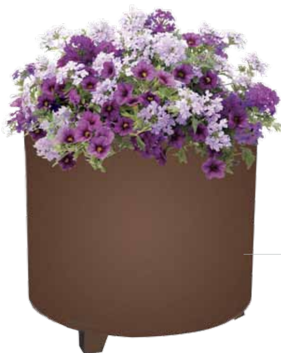
Acabado color MARSON Finition teinte MARSON MARSON color finish