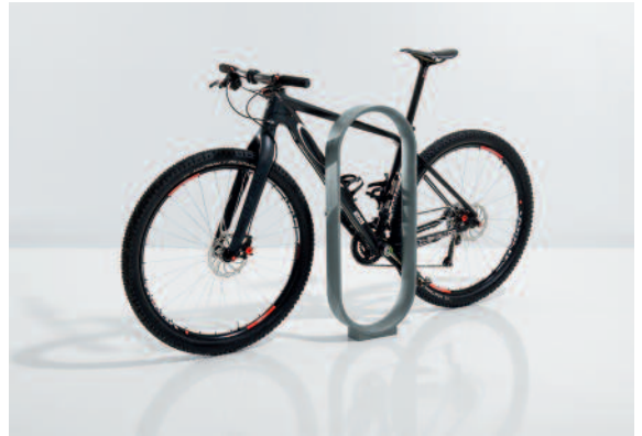
Mit 35 cm Länge bietet Oho ausreichend Möglichkeiten zum Anschließen eines Fahrradrahmens.