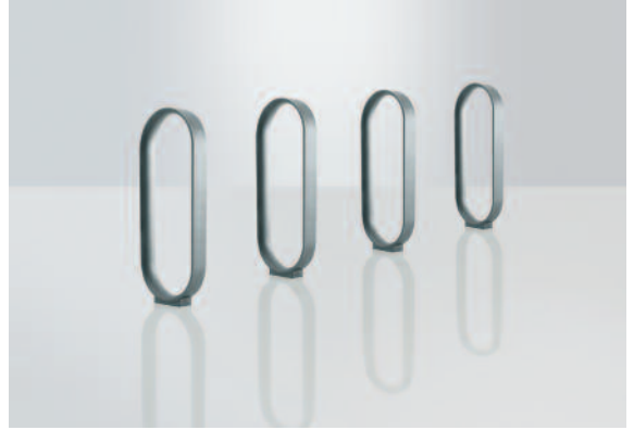
Oho in Reihenaufstellung: im Stadtbild zeitlos unauffällig.