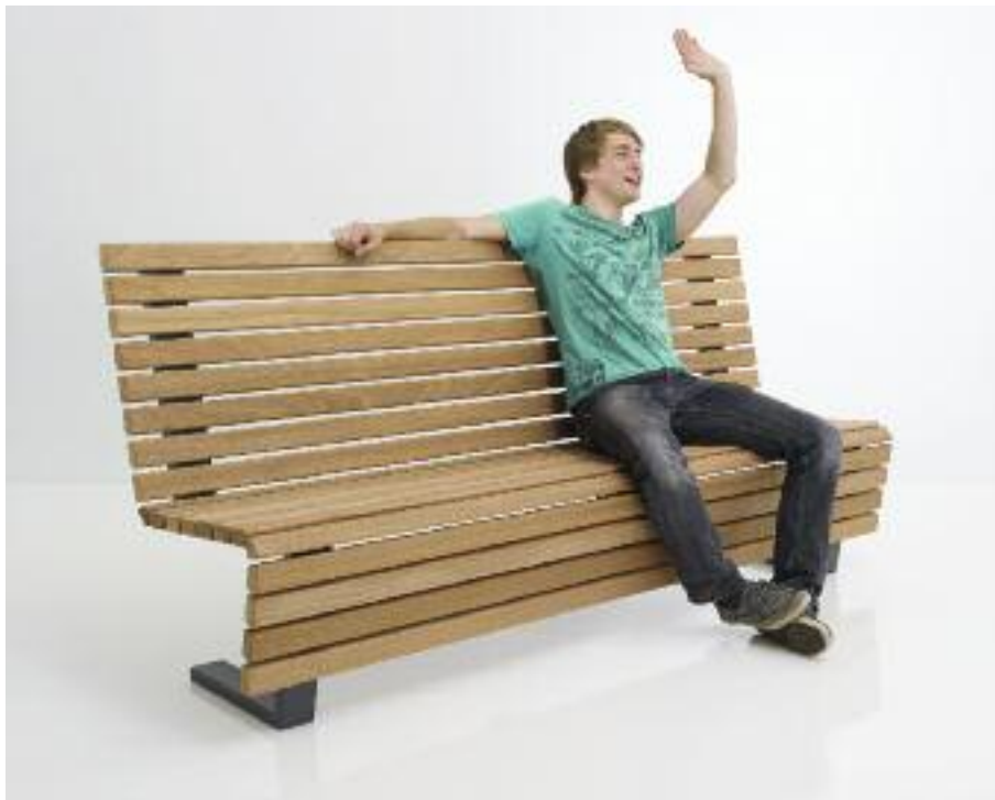
Die bequeme Bank Scala bietet sehr angenehmen Sitzkomfort durch die besonders hohe Rückenlehne.