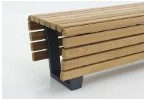
Hockerbank Scala mit Stahlfuß aus 80/30er Rechteckrohr mit verdeckter Verschraubung der Holzleisten.