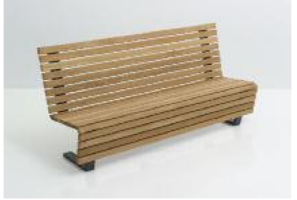
Scala mit angenehm hoher Rückenlehne und sitzbequem nach hinten geneigter Sitzfläche (Art. 2303-F1401FSCN).