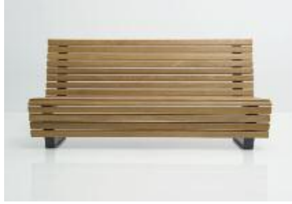
Bank Scala mit insgesamt 20 Sitz-, Rücken- und Frontleisten aus FSC-zertifiziertem Hartholz.