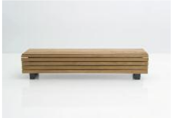
Auch die Hockerbank Scala (Art. 2303-F1400FSCN) bietet durch die tief ansetzenden Leisten einen geschlossenen Körper.