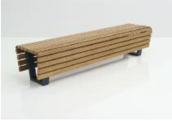
Hockerbank Scala mit FSC-zertifizierten Hartholzleisten und Stahlfüßen, feuerverzinkt und DB 703 Eisenglimmer Anthrazit lackiert.