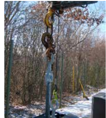
Indkast med skjulte løftekroge.

For at sikre at renovatøren eller andre ikke falder i betoncontaineren, mens tømningen foregår, hejses en platform automatisk i hullet. Sikkerhedsplatformen er kontravægt styret, så platformen følger med op når affaldsbeholderen løftes op af containeren.