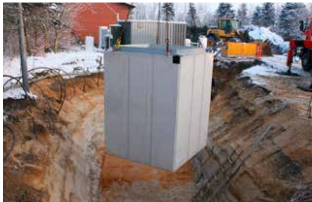
Betoncontaineren placeres i det klargjorte hul.