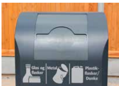
Indkast med flaskeindkast.