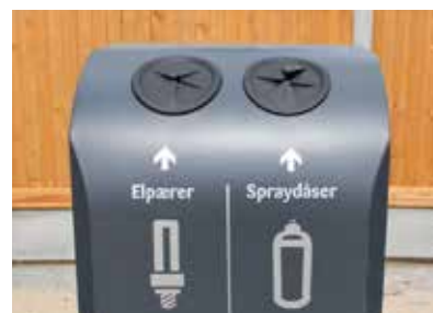
Indkast med gummiflapper.