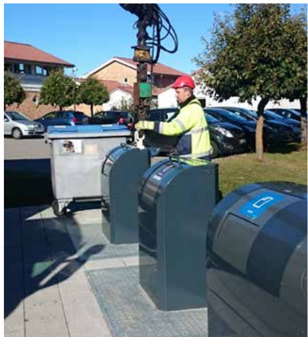
EUROPAplus kan tømmes af en mand og fås med 1, 2 eller 3 kroge.