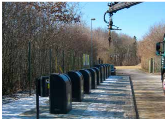
Efter tømning sættes containeren på plads.

Efter tømning hejses containeren sikkert tilbage. Overdelen sænkes ned over containeren. Tømningsprocessen er udført.