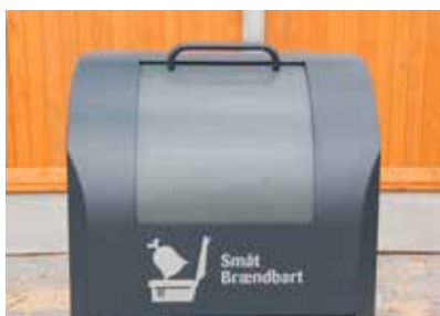
Indkast med skuffetromle.

Med EUROPAplus behøver man kun en type affaldsindkastenhed på trods af de mange forskellige typer affald. Selve toppen er altid den samme og det der ændres er udformningen af selve indkastet. Nedenfor er vist tre forskellige typer indkast. EUROPAplus fås fx med et rundt hul til flasker eller et aflangt indkast til papir og aviser. Volumenet af hver enkel affaldsindkast kan variere fra 20-80 liter afhængigt af affaldstypen. Renovatøren kan hurtigt tjekke det indvendige af affaldsindkastet ved at åbne den foreste låge.