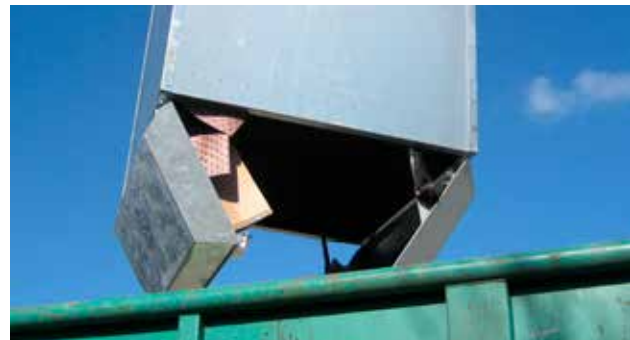
Containerens to bundstykker åbnes og affaldet ryger ud.

Bunden af den galvaniserede stål container er delt i to skåle, som hver kan indeholde ca. 80 liter perkolat fra affaldet. For at undgå at perkolat løber ud mellem de to skåle i affaldscontaineren til flasker, er der monteret en ekstra væskesikring i form af en stålvinkel der dækker hele åbningens længde.