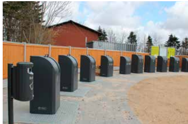
Miljøstation i Horne (Varde Kommune) med 10 fraktioner.