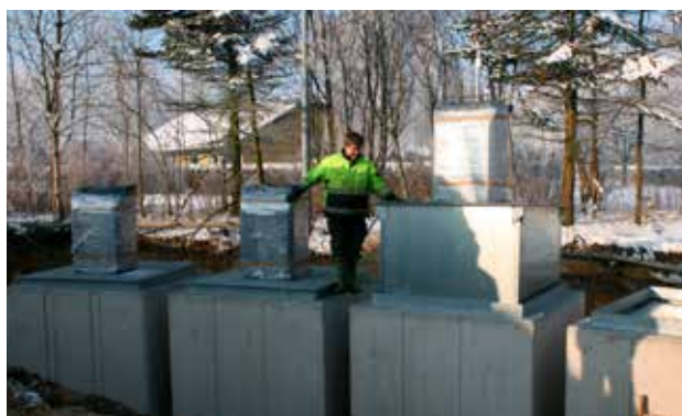
Opstilling i en cirkelbue. Inderbeholder placeres i betoncontaineren.