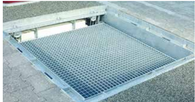
Sikkerhedsplatform der løftes automatisk.

For at sikre at renovatøren eller andre ikke falder i betoncontaineren, mens tømningen foregår, hejses en platform automatisk i hullet. Sikkerhedsplatformen er kontravægt styret, så platformen følger med op når affaldsbeholderen løftes op af containeren.