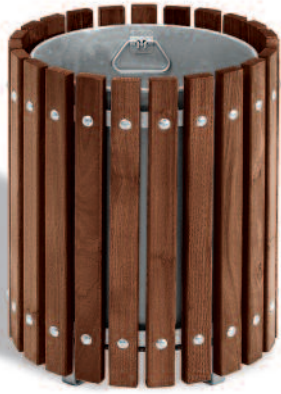
Handgriffe zur Entnahme des Innenbehälters.