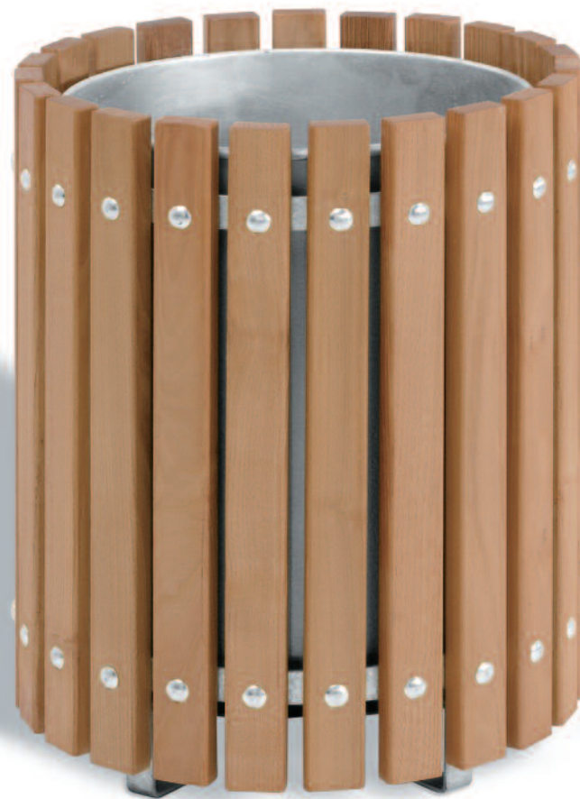
Art. 3630-F1300FSCN Abfallbehälter Swing, naturbelassen.

mit Handgriffen zur Entnahme des Innenbehälters | langlebige Holzart | auch als Pflanzkübel