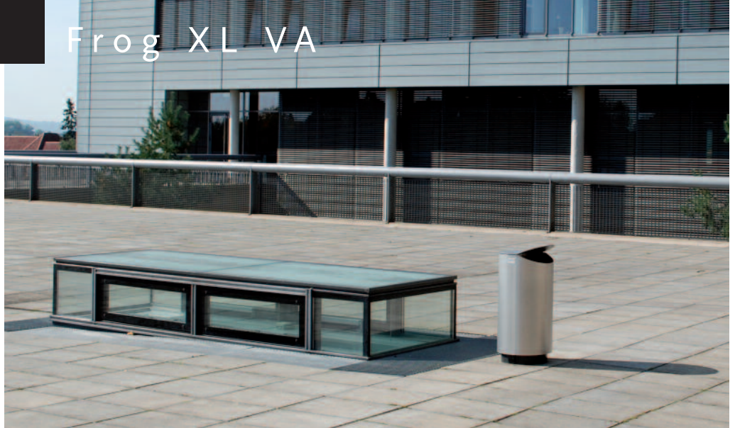
Frog XL VA aus matt gestrahltem Edelstahl.