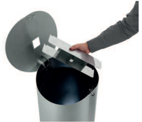
Maxi-Ascher separat entleerbar nach Glutsichtkontrolle.