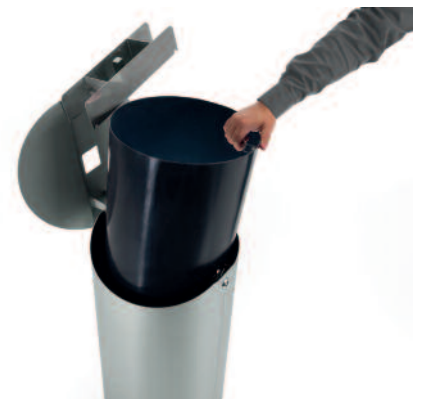
Leichter, herausnehmbarer PE-Innenbehälter mit Griff. Ascher kann während der Entleerung am Deckel eingehängt werden.