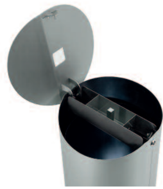
Frog XL VA mit Ascher (Art. 8434-F1403), geöffneter Deckel arretiert bei 100 Grad.