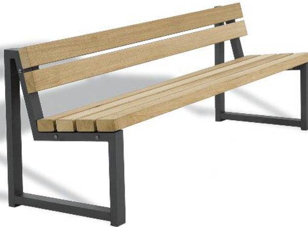
Abb. Art. 3203-F1451FSCN, L 200 cm, naturbelassen zur Vergrauung durch UV-Strahlung. FüÙe als Zusatzausstattung in DB 703 Eisen glimmer Anthrazit lackiert.