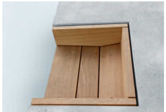
Die nach unten gewölbte Sitzfläche bietet besonders angenehmen Sitzkomfort.