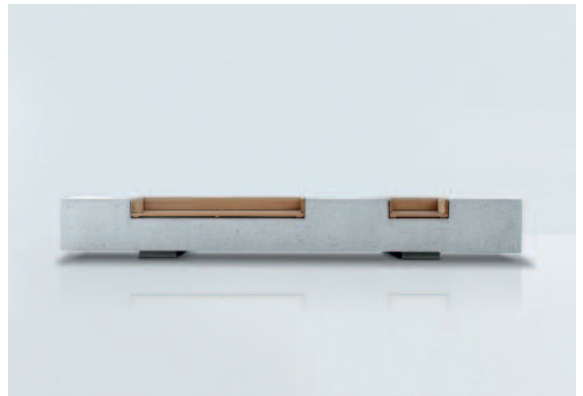
Der massive Betonquader von Concreta „schwebt“ 8 cm über dem Boden.