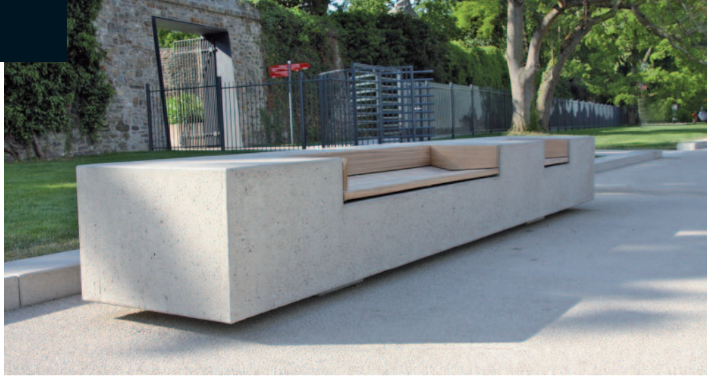
Concreta auf der Bundesgartenschau 2011 in Koblenz mit nach vorne gerichteten Sitzöffnungen. Art. 8207-F1403FSCN.