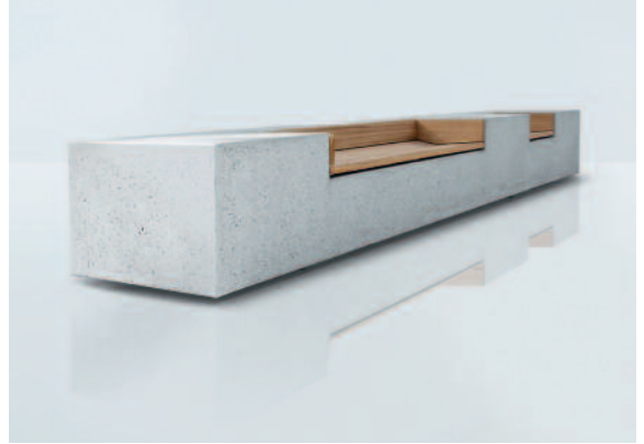
Concreta Betonbank mit naturbelassenen FSC-zertifizierten Hartholzleisten (Art. 8207-F1403FSCN).